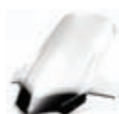
Pare brise haut